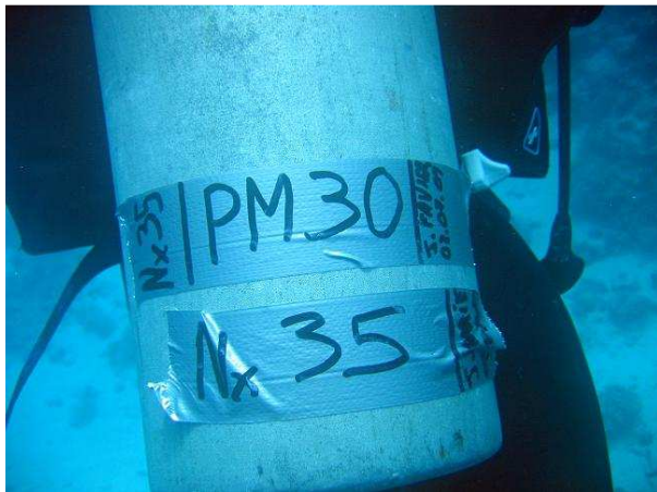
Le marquage des blocs : Une étape primordiale